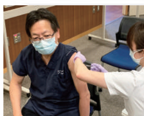
トップバッターは阪越病院長

4月より広報担当となり、初めての発刊号となります。 只今、梅雨時期真っ只中。湿度が多くジメジメとしてこの時期は本当に嫌ですよね… 又、コロナ感染症もワクチン接種により、徐々に良くなっているとは思いますが、まだまだ遠出するのは恐いです…コロナが収まったら旅行に行きたいです。 現状、まだまだ厳しい状況が続きますが、医療従事者として少しでも役に立てるよう頑張ります。日常生活が1日も早く元に戻ることを願っています。 M記