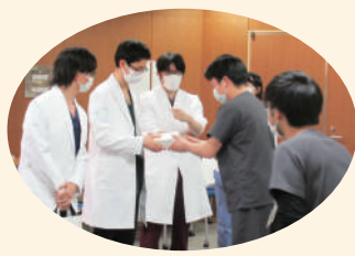
恒例の後輩研修医からのプレゼント授与の様子